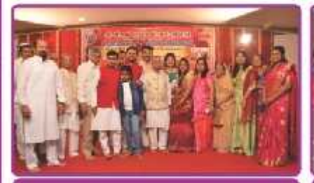
બારમી સમહ પહેડીનાં દાતા પરિવાર