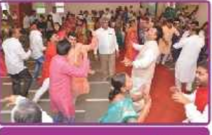
ગરબા રાસ રમતા ભાવિકો