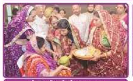
ભોઈમાને ખોળો ભરાવતા લાભાર્થી પરિવાર